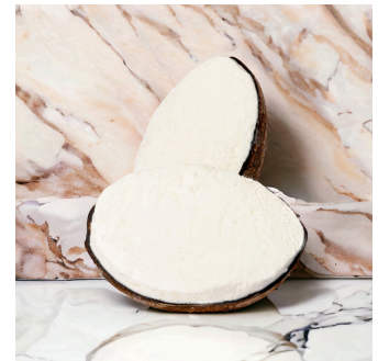
Coco 29 Coconut