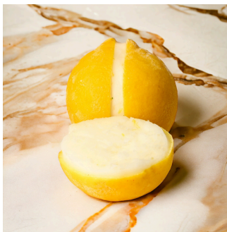
Citron jaune 11 Lemon