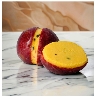
Passion 13 Passion fruit